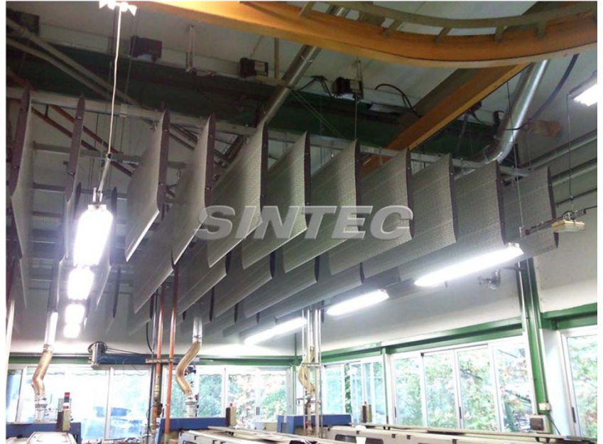
Baffles de diseños y dimensiones especiales

Los baffles AISFÓN están especialmente indicados para aquellos lugares en los que las condiciones de la instalación no permitan la colocación de techos absorbentes continuos. El montaje se realiza mediante suspensión por cable y anilla.